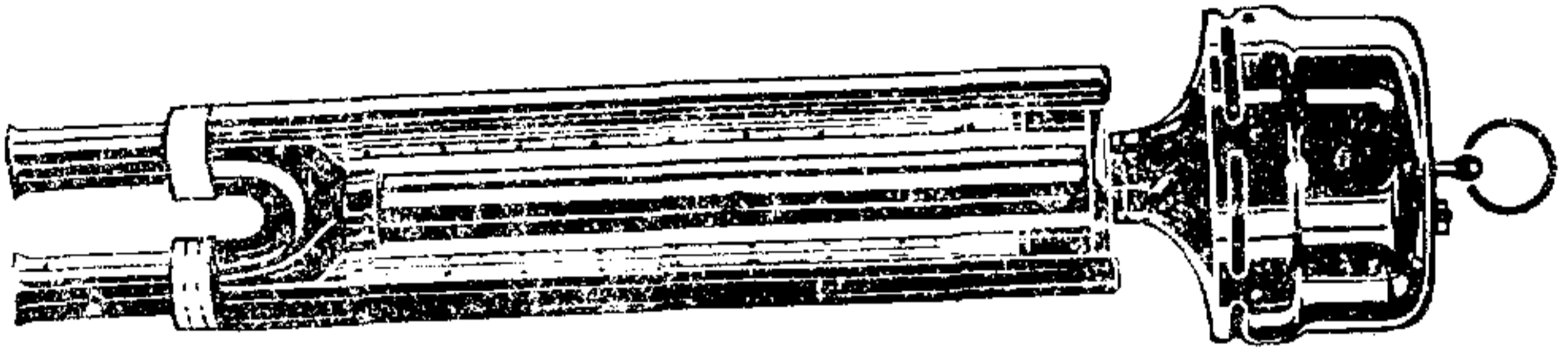
شكل (١) مقياس البسكرومتر

توجد من هذه الاجهزة نماذج مختلفة منها المزود بجرس حيث تفلق دارة الجرس قبل حدوث الصقيع ومنها جهاز الانذار الاشعاعي ويتألف من لوح معدني بسيط محاط بسطل اسطواناني الشكل مفلق من الاسفل ومفتوح من الاعلى ومزود بترموستات ينذر بحدوث الصقيع قبل ساعة واحدة من بلوغ درجة الحرارة الجافة الصفر المثوي .